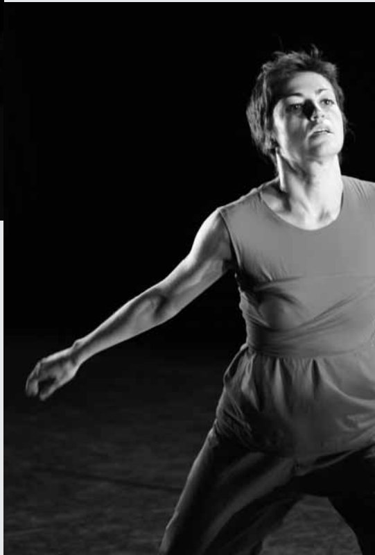
„Hidden Voices“

The performing body can be understood through a conceptual and visual framework – opening the way for a different cultural identity and context for live performance. ROSEMARY BUTCHER